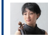
坂口 昌優 (ヴァイオリン)