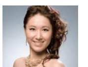
山本 有希子(ソプラノ)