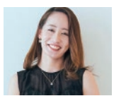
篠原 悠那 (ヴァイオリン)