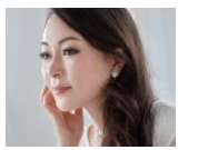
秋本 悠希(メソソプラノ)