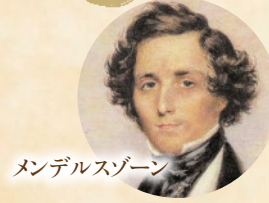
メンデルスゾーン