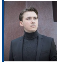
コンスタンティン・インゲンバス(バリトン)